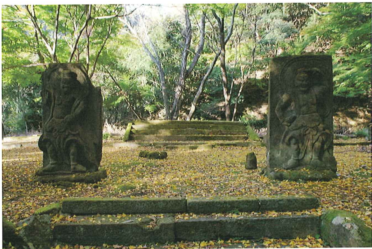
旧千燈寺跡（国見町）